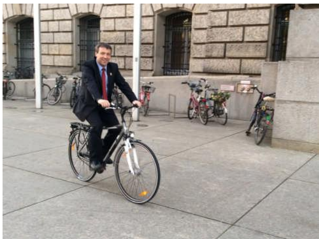
Auf dem Weg zur Arbeit