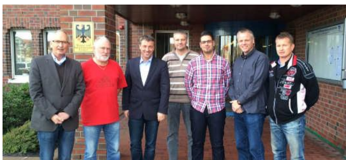
Gespräch beim Personalrat der Wasser- und Schifffahrtsamtes Emden...

Wir sind uns einig, dass die Regierung Maßnahmen ergreifen muss, um die notwendigen regionalen Kompetenzen zu sichern. Das werde ich nach der Verlegung der WSD nach Bonn als positives Zeichen.