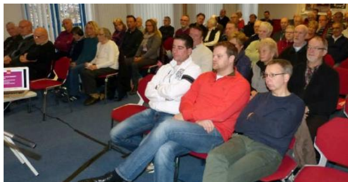
Teilnehmer der Regionalkonferenz in Emden

Ich freue mich auf die jetzt beginnende Arbeit in Berlin!