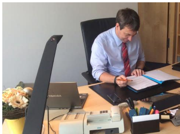
Bei der Arbeit im Büro