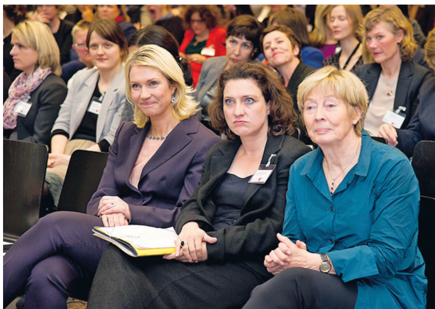
Gemeinsam für die Quote: Manuela Schwesig, Carola Reimann und Christine Bergmann auf dem Empfang der SPD-Fraktion zum Internationalen Frauentag.

Der Bund geht dabei mit gutem Beispiel voran: In Aufsichtsgremien, in denen dem Bund mindestens drei Sitze zustehen, soll für diese Mandate ab 2018 sogar eine Geschlechterquote von 50 Prozent bei Neubesetzungen erfüllt sein. Zudem soll die Bundesverwaltung für jede Führungsebene konkrete Zielvorgaben zur Steigerung des Frauen- oder Männeranteils erlassen.