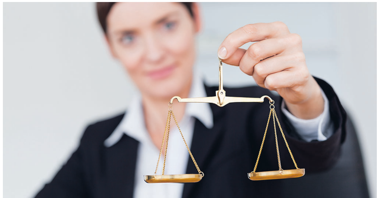
Die SPD-Bundestagsfraktion sorgt mit Gesetzesänderungen für mehr Gerechtigkeit zwischen Frauen und Männern.

Die SPD-Bundestagsfraktion sorgt nun mit gesetzlichen Regelungen dafür, dass sich das ändert. Ein zentraler Baustein auf dem Weg hin zu mehr Geschlechtergerechtigkeit ist die gesetzliche Frauenquote: Mindestens 30 Prozent der frei werdenden Aufsichtsratsposten in börsennotierten und voll mitbestimmungspflichtigen Unternehmen müssen ab 2016 Frauen bekleiden. Wird die Quote nicht erfüllt, bleibt das Aufsichtsratsmandat unbesetzt. SPD-Fraktionschef Thomas Oppermann ist sicher, dass Frauenkarrieren damit vom Ausnahmefall zur Normalität werden: „Diese gesetzliche Intervention wird eine ‚kritische Masse‘ an Frauen in die Führungsgremien der deutschen Wirtschaft bringen, die unsere Kultur verändern wird.“ Wenn auch nicht alle Frauen unmittelbar