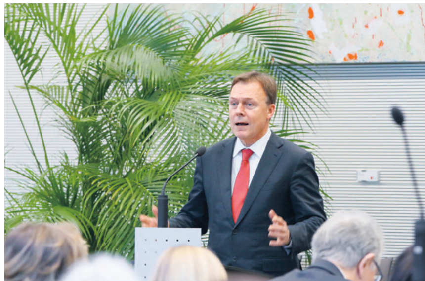
SPD-Fraktionschef Thomas Oppermann: „Ein großes Projekt für eine Große Koalition“.

Die Einwanderung soll nach einem flexiblen und nachfrageorientierten Punktesystem erfolgen. Je nach Bedarf könnte eine jährliche Quote dafür festgelegt werden, wie viele Personen über