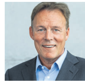
Thomas Oppermann, Vorsitzender der SPD-Bundestagsfraktion.