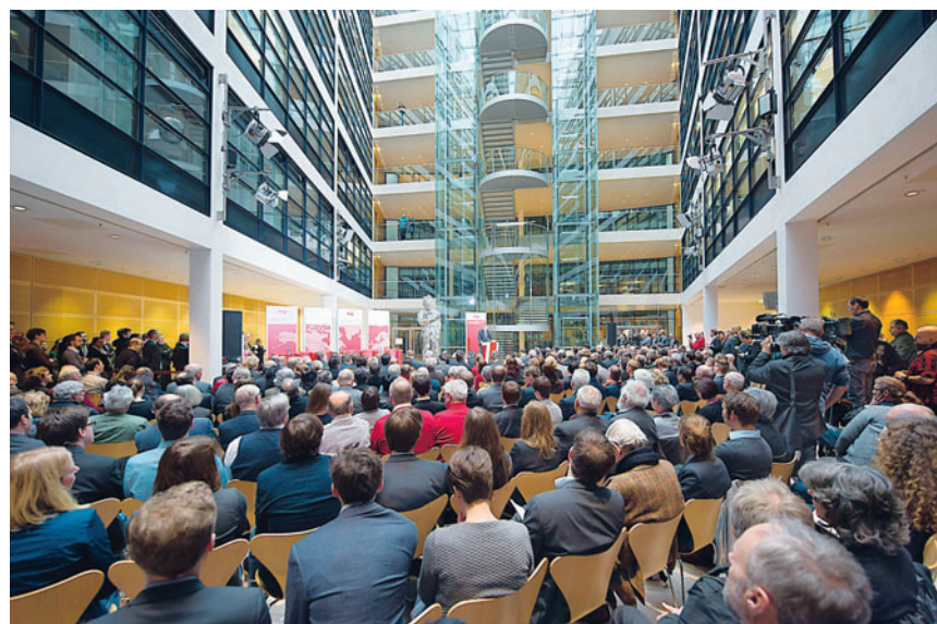
Wichtiges Thema, großes Interesse: Das Willy-Brandt-Haus bei der Freihandelskonferenz.

Nach Abschaffung der Wehrpflicht konkurriert die Bundeswehr als Arbeitgeberin mit anderen Bereichen des öffentlichen Dienstes und mit der freien Wirtschaft um kluge Köpfe und starke Arme. Deshalb hat der Bundestag auf Antrag der Fraktionen von SPD und Union ein Gesetz beschlossen, mit dem die Attraktivität der Bundeswehr als Arbeitsgeber gestärkt wird. Die SPD-Fraktion setzt sich seit langem für bes-