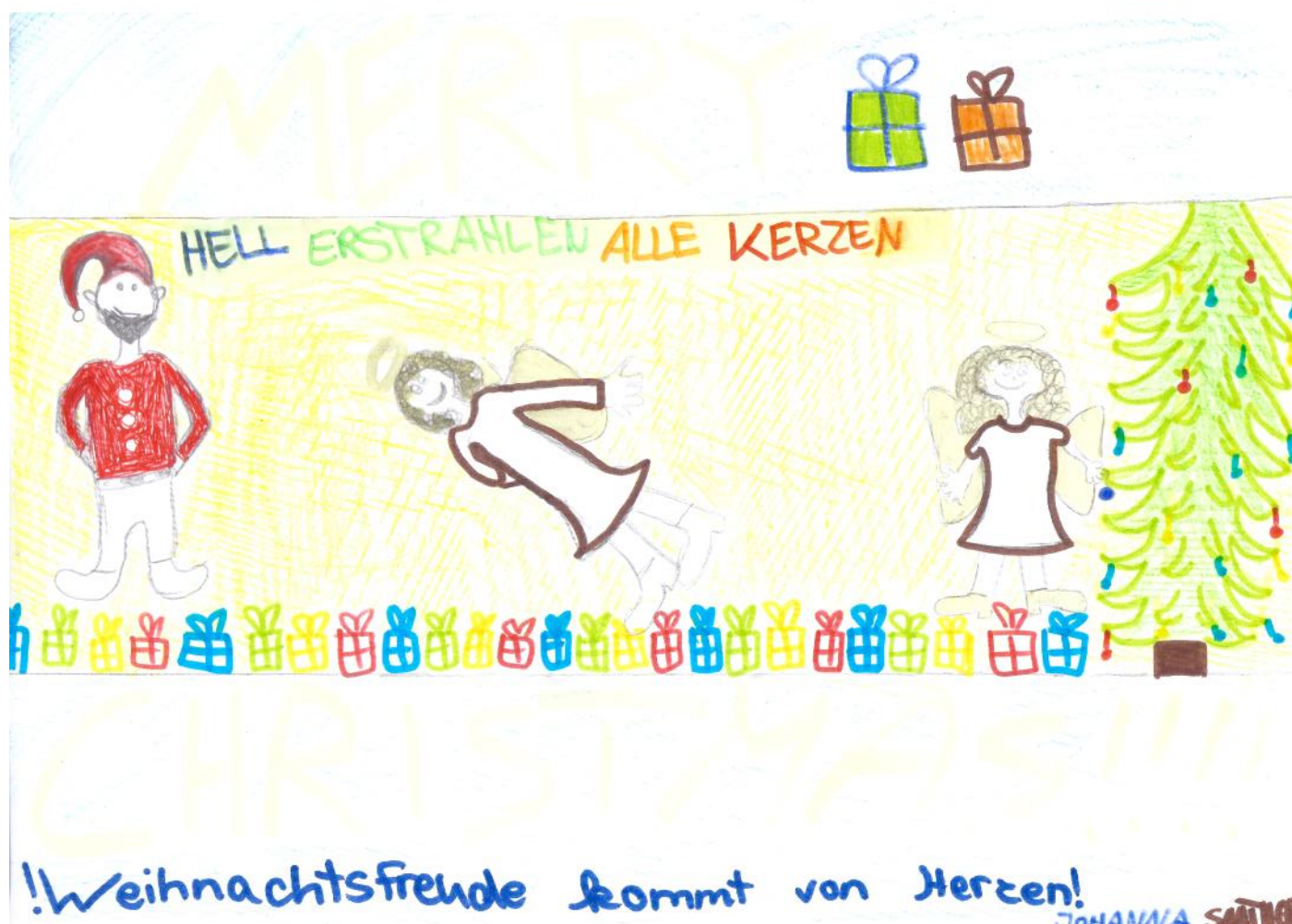
Gemalt von Johanna Saathoff, 11 Jahre

Mein Team und ich wünschen allen ein frohes und besinnliches Weihnachtsfest und ein gutes, gesundes und glückliches Jahr 2017!