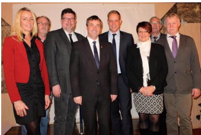
Erneut eine gelungene Veranstaltung: Der Neujahrsempfang des SPD-Ortsvereins Rechtsupweg.