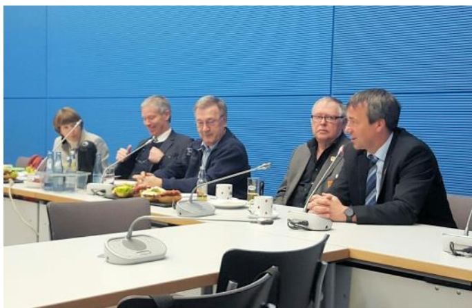
Mit der Spitze des Deutschen Fischerei-Verbandes im Fraktionssaal der SPD.

Auf der Tagesordnung standen in diesem Jahr unter anderem die noch nicht absehbaren Folgen eines Brexits und die überwiegend erfreuliche Entwicklung der Fischbestände. Als Berichterstatter für Fischereifragen ist dieses Gespräch für mich immer eine tolle Sache.