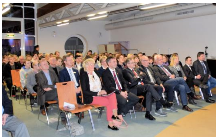
Foto l.: Die Veranstaltung in der KGS Großefehn war sehr gut besucht.

In meiner Rede (Foto oben) habe ich noch einmal deutlich gemacht, dass wir um unser Duales Ausbildungssystem auf der ganzen Welt beneidet werden. Wir lassen uns dieses System einiges kosten, aber die Ausgaben sind es wert, damit unsere Wirtschaft und unsere Gesellschaft so stabil bleibt, wie sie ist. Es hat mir viel Freude bereitet, den jungen Menschen ein paar Dinge für die Zukunft mit auf den Weg geben zu können.