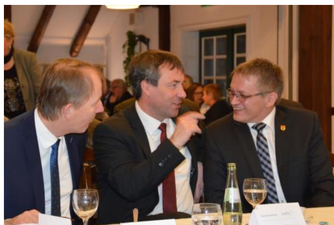
Im Gespräch mit Landrat Harm-Uwe Weber und Bürgermeister Olaf Meinen auf dem Neujahrsempfang in der Gemeinde Großefehn.