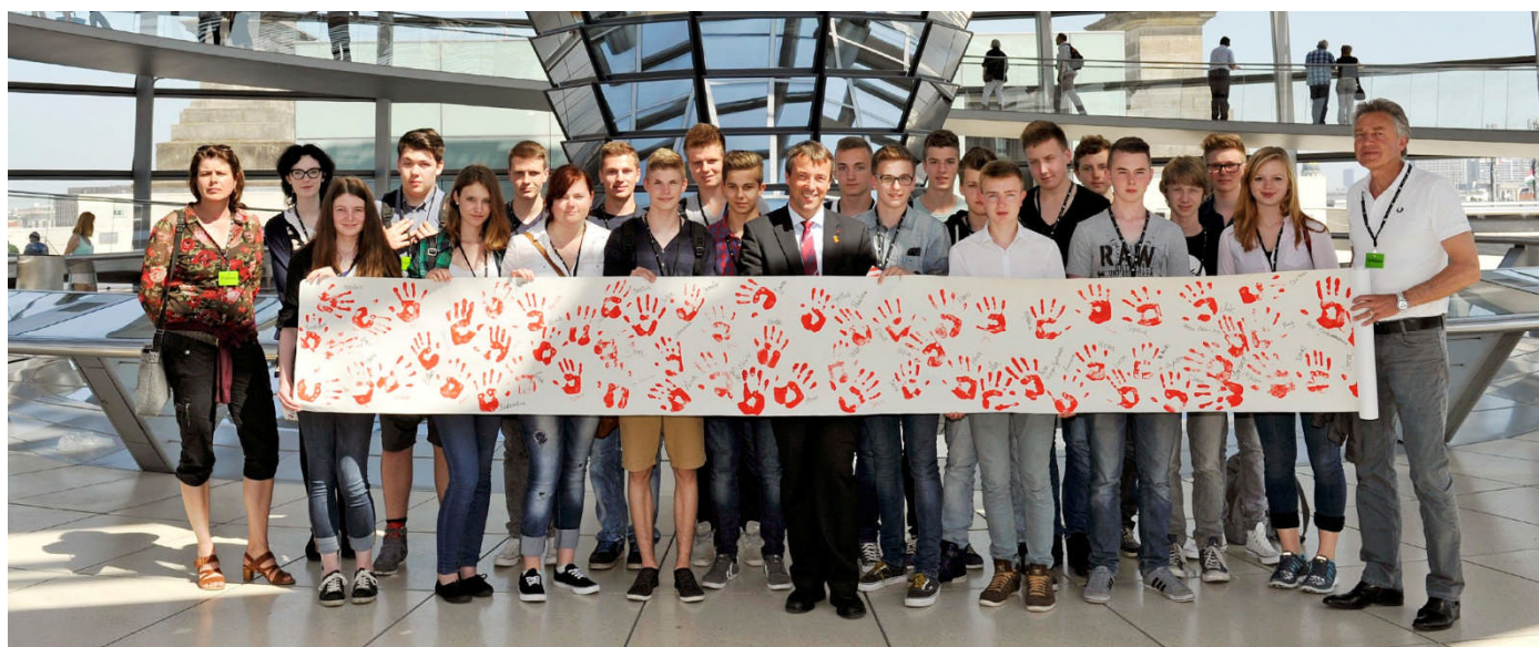
Die Schülerinnen und Schüler des Gymnasiums am Treckfahrtstief in Emden mit Johann Saathoff und den „Red-Hands“ in der Kuppel des Reichstags

Abschließend haben wir bei strahlendem Sonnenschein in der Kuppel des Reichstages ein Erinnerungsfoto samt „Red-Hands“ geschossen.