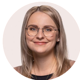
Natalie Pawlik MdB

D eutschland braucht viele qualifizierte Fach- und Arbeitskräfte. Der große Bedarf ist bereits jetzt in unserem Alltag enorm spürbar. Kunden müssen wochenlang auf einen Termin mit Handwerker:innen warten, Restaurants reduzieren ihre Öffnungszeiten, weil sie keine Servicekräfte finden.