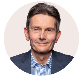
ROLF MÜTZENICH MDB Vorsitzender der SPD-Bundestagsfraktion

W ir starten nach einem arbeitsreichen Halbjahr nun in die parlamentarische Sommerpause. Als Fortschrittskoalition haben wir uns den großen Herausforderungen unserer Zeit – Klimakrise, Krieg in Europa und hohe Energiepreise – in den vergangenen Monaten erfolgreich gestellt.