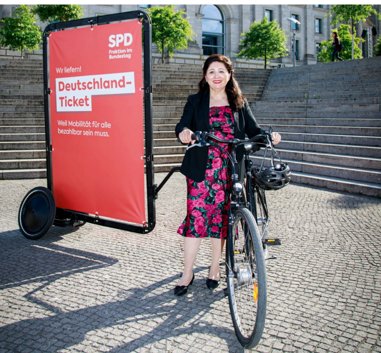
Nezahat Baradari, MdB

Grünes Licht für einen günstigen öffentlichen Nahverkehr: Seit dem 1. Mai 2023 gibt es das Deutschlandticket, die deutschlandweite ÖPNV- und Regio-Flat für 49 Euro im Monat. Mit dem Ticket können Busse und Bahnen im gesamten Nah- und Regionalverkehr in Deutschland genutzt werden. Das Deutschlandticket revolutioniert den öffentlichen Nahverkehr. Mobilität wird nachhaltiger und für viele Menschen bezahlbarer. Es ist eine wichtige Entlastung für viele Pendler:innen und ein wegweisender Baustein der Mobilitätswende.