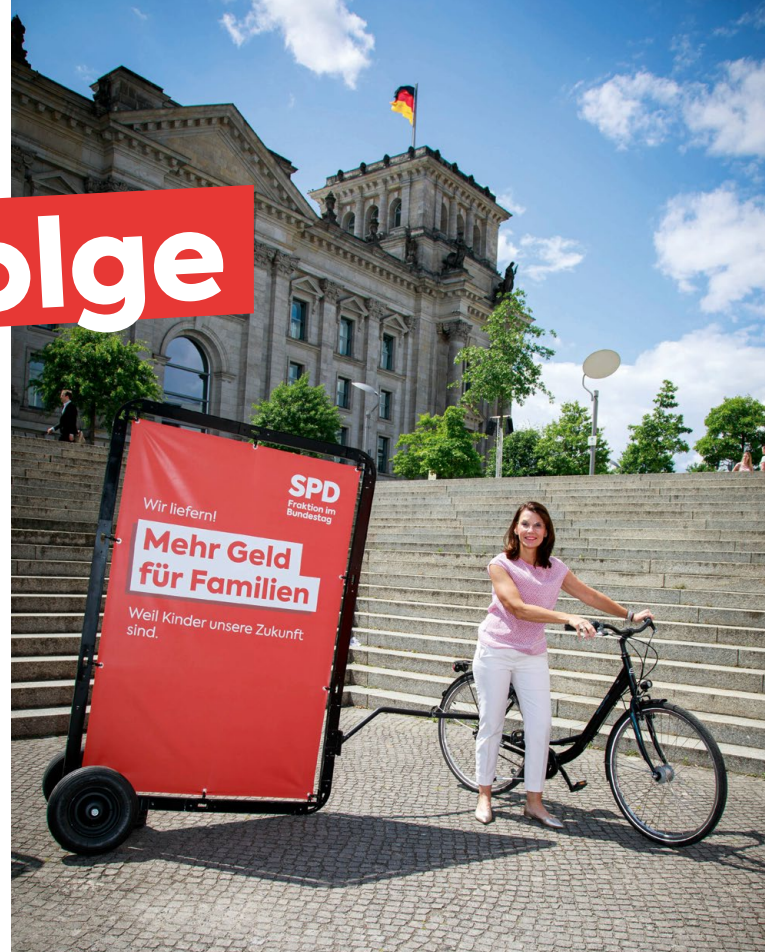
Rita Schwarzelühr-Sutter, MdB

Die Renten sind zum 1. Juli 2023 um 4,39 Prozent im Westen und um 5,86 Prozent im Osten gestiegen. Durch die kräftigen Rentenerhöhungen 2022 und 2023 wird die Rentenangleichung Ost ein Jahr früher erreicht als geplant – damit gilt nun ein gleicher Rentenwert in Ost und West. Mit dem Härtefallfonds hat der Bund darüber hinaus eine Stiftung zur Abmilderung von Härtefällen aus der Ost-West-Rentenüberleitung, für jüdische Kontingentflüchtlinge und jüdische Zuwander:innen aus der ehemaligen Sowjetunion sowie für Spätaussiedler:innen eingerichtet. Die Betroffenen können bis 30. September 2023 einen Antrag auf eine Einmalzahlung von 2.500 Euro stellen. Seit Ende Juni werden die ersten Leistungen ausgezahlt.