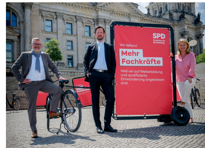
v.l.n.r.: Dietmar Nietan, Dirk Wiese, Sabine Poschmann, alle MdB

Für viele Betriebe ist der Fachkräftemangel die größte Herausforderung. Auch der Arbeitsmarkt verändert sich: Einige Berufe fallen weg, andere entstehen. Deshalb brauchen wir ein Aus- und Weiterbildungssystem auf der Höhe der Zeit, um inländische Potenziale zu heben. Dazu vereinfachen wir die Weiterbildungsförderung und öffnen sie für alle Betriebe. Zudem führen wir ein Qualifizierungsgeld ein. Damit ermöglichen wir Beschäftigten in Betrieben im Strukturwandel, sich zu Fachkräften weiterzuentwickeln. Während der Weiterbildung tragen die Betriebe die Weiterbildungskosten, und die Beschäftigten erhalten das Qualifizierungsgeld als Lohnersatzleistung.